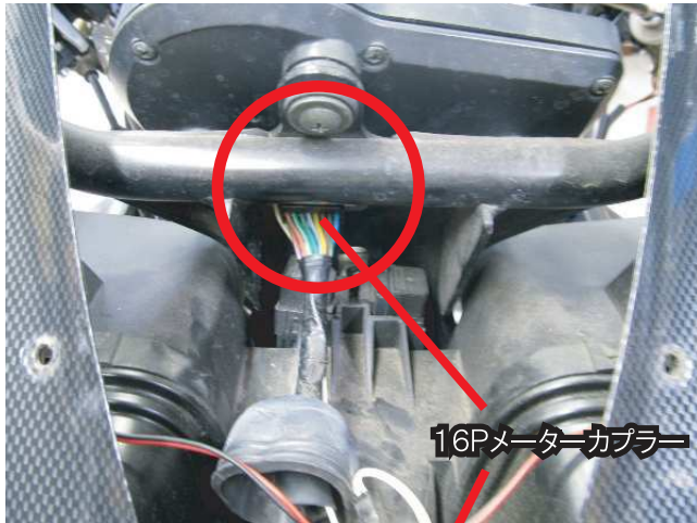
16Pメーターカプラー