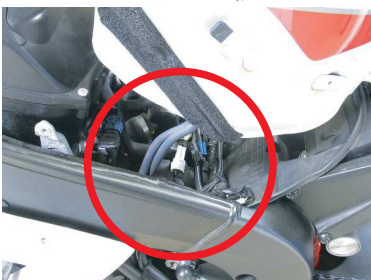
シート下のECU 34Pカプラー