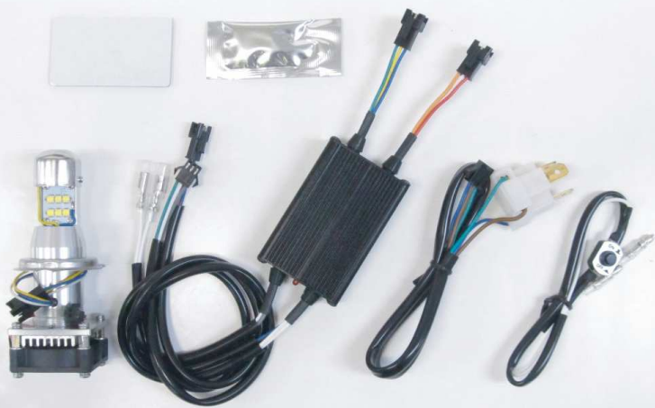
画像はNo.65069 【LB4HL-S】 H4バルブです。