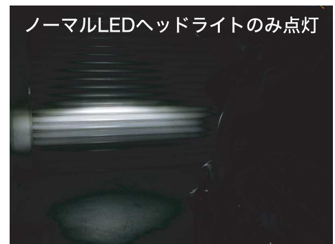
ノーマルLEDヘッドライトのみ点灯

※別売りのアイドリング減光ユニットRSE-01は車両の仕様により取り付け不可となります。