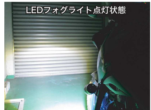
LEDフォグライト点灯状態