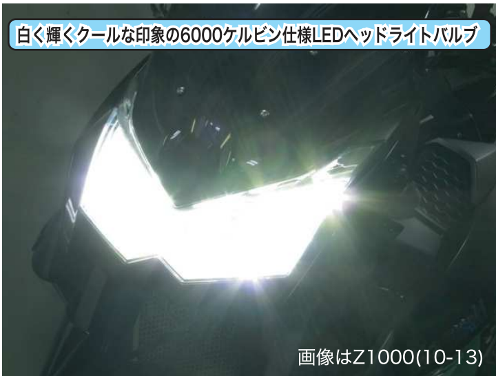
白く輝くクールな印象の6000ケルビン仕様LEDヘッドライトバルブ

※本製品のみではLED Loビーム2灯にはなりません。Loビーム側にはNo.65029【LB7-S】の同時装着が必要です。