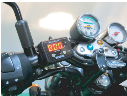
表示部本体はハンドルバーステーで取付け。